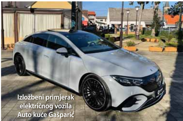
Izložbeni primjerak električnog vozila Auto kuće Gašparić

Dani karijera nastavljeni su radionicom Hrvatskog zavoda za zapošljavanje na temu pisanja životopisa, zamolbi i intervjua za posao, a sve je završilo bogatim programom u petak, 22. ožujka. Naime, dan je započeo radionicom Work - life balance : Vještine koje su ti potrebne te se nastavilo iskustvima uspješnih tvrtki pod nazivom Optokompas: vodič kroz karijere u optometriji, kroz koji su se predstavili Ghetaldus Optika d.d. , Rimc d.o.o. , Polikolinika Vukas , Optika Mikulin i Očna poliklinika Optical Expres .