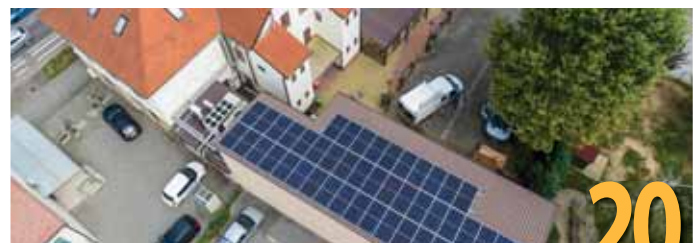
Projekt Velika Gorica Solarni grad