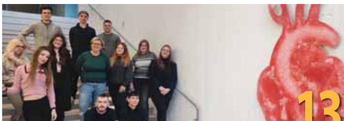
Studenti i nastavnici u Tartu Health Care Collegeu