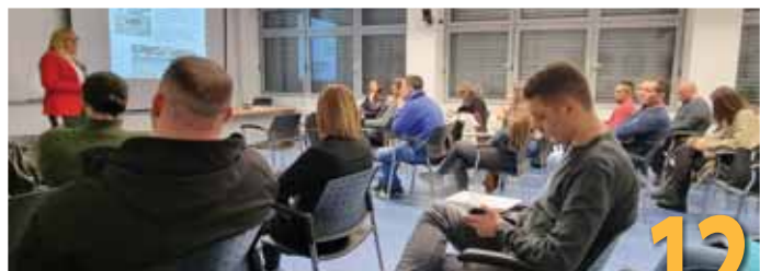
Priče o uspjehu naših alumniija