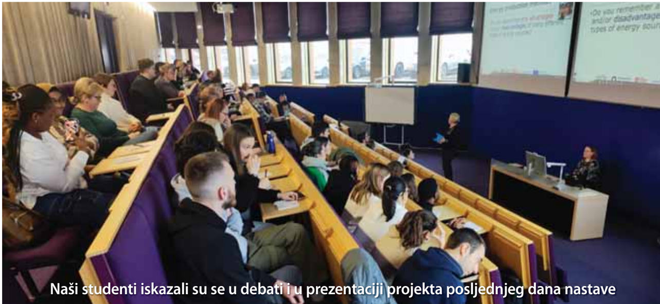
Naši studenti iskazali su se u debati i u prezentaciji projekta posljednjeg dana nastave